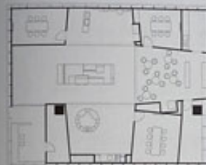
Size 252 m 2 | Exhibitor KODAK Alaris Germany GmbH, Stuttgart | Concept and Architecture SOMAA | Concept and Graphics tat.sache GmbH, Stuttgart | Construction ARTec360 GmbH, Wessenberg

Beinahe zu jeder Gelegenheit zücken wir unser Smartphone, um Erinnerungen digital festzuhalten,