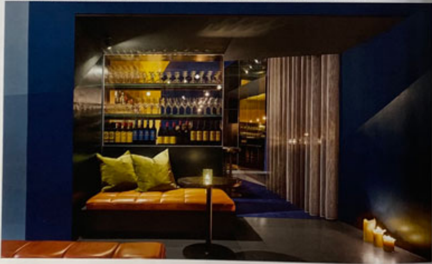
Glinzernde Messing-Oberflächen und glitzernde Stimmgitter ziehen die Blicke auf den Barbereich... Shiny brass surfaces and glittering glass shelves draw attention to the built-in bar unit.