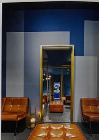
... und wird zum Unendlichkeitsspiegel ergänzt... and is completed to become an infinity mirror.