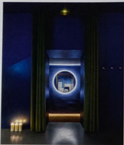
Der leuchtende Spiegel weist den Eingang... The illuminated mirror indicates the entrance...